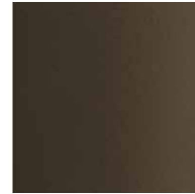
35029 ANODITE BRONZE 545