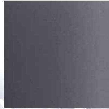
35013 ANODITE IRON GREY 715