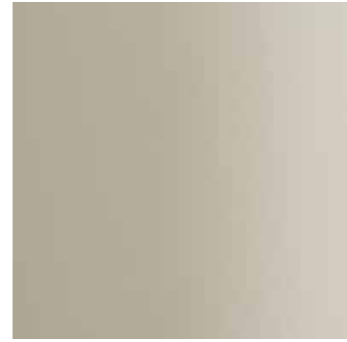
36168 ANODITE PALE GOLD 541