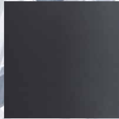
36486 ANODITE DARK GREY 717