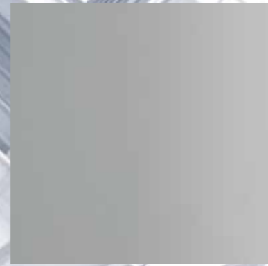
30919 ANODITE SILVER C0