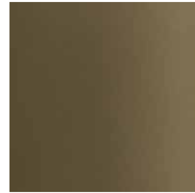
30898 ANODITE BRONZE C33