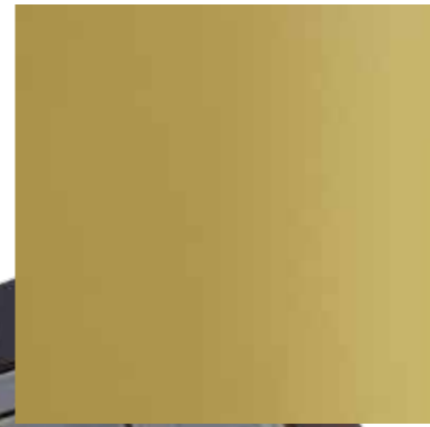
35704 ANODITE GOLD 2,5