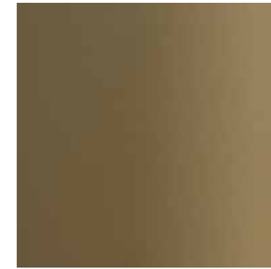
35762 ANODITE LIGHT BRONZE 543