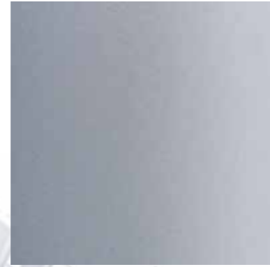
36143 ANODITE MEDIUM GREY 711