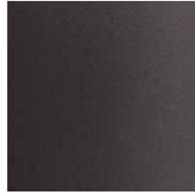
35476 ANODITE DARK BROWN 549