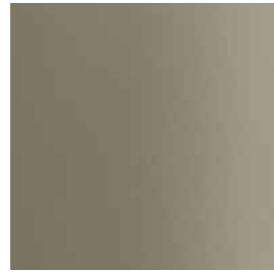
31304 ANODITE LIGHT GREY C31